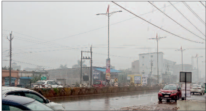
जिले में चना, अरहर, गेहूं मुख्य फसल

सामान्य तौर पर जिले में किसानों के द्वारा चना, अरहर और गेहूं की फसल ही मुख्य रूप से ली गई है। मौसम के बिगड़े मिजाज दलहन के बड़े रकबा की फसल को ख़ासा प्रभावित कर चुका है। खरहाल वर्तमान हालात में बने स्थिति के बारे में जब अंचल के किसानों से बात की गई तो उन्होंने बताया कि निश्चित रूप से मौसम में बड़ी ठंड से किसान ख़ासा उम्मीद लगाए तो बैठे थे पर हालात विपरीत नजर आ रहे हैं।