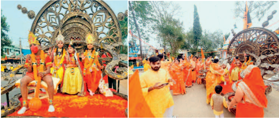
रथ पर सवार प्रभु श्रीराम लखन ने किया नगर भ्रमण : गुरूर। पांच सौ सालों बाद अयोध्या में श्रीरामलला की प्राण प्रतिष्ठा एवं प्रभु श्री राम के भव्य मंदिर निर्माण की खुशी चारों ओर छाई रही। इस ऐतिहासिक पल की खुशी में सहभागी बनने सभी ने तैयारी करते हुए नगर में विविध आयोजन किया गया। नगर में माहेश्वरी समाज द्वारा प्रातः भव्य शोभायात्रा निकाली गई। प्राचीन कालभैरव देऊर मंदिर से पूजा-अर्चना के बाद शोभायात्रा श्रीराम जानकी मंदिर के लिए निकली। रथ पर प्रभु श्रीराम, लक्ष्मण, जानकी की वेशभूषा में बच्चे सम्मिलित हुए। इनकी जगह-जगह आरती उतारी गई। राम मंदिर में रामलला की प्राण प्रतिष्ठा के बाद आठुतियां दी गईं। शाम को सुंदरकांड, हनुमान चालीसा का पाठ किया गया। प्रत्येक घरों में रंगोली सजाई गई, शाम को दीपमालिका सजाई गई व आतिशबाजी की गई।