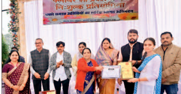
ये रहे विजेता